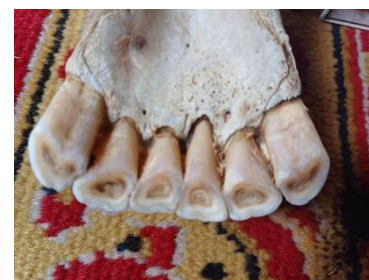
Адууны шүдний үзүүлэн

7. Дэлгэрхангай, Дэрэн, Говь-Угтаал сумдын малчдын зөвлөгөөнд нийт 320 гаруй малчинд монгол улс, тэр дундаас Дундговь аймгийн нутаг бэлчээрт дасан зохицох чадвартай, нутгийн монгол малд сайжруулагчаар ашиглах боломжтой үүлдэр омгийн малын танилцуулга мэдээллийг танилцуулсан. Малын генетик нөөцийн тухай хуулинд 2023 оны 12 сард орсон заалтын өөрчлөлт шинэчлэлтийг малчидад танилцуулж, тооцох хариуцлагын хэм, хэмжээг танилцуулж, шинэлэг мэдээ, мэдээллээр ханган ажилласан.